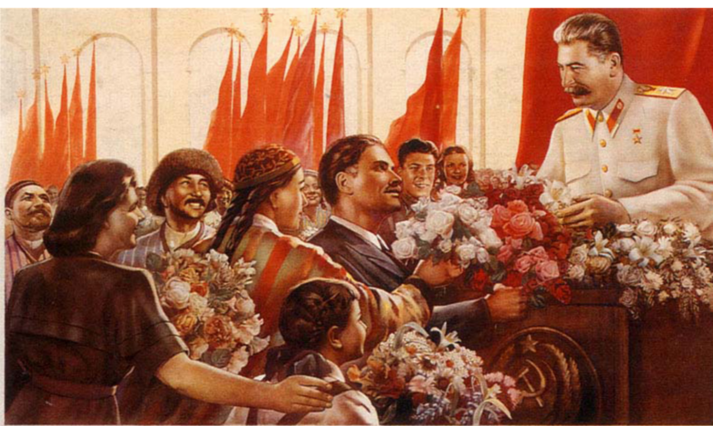
ВЕЛИКИЙ СТАЛИН-ЗНАМЯ ДРУЖБЫ НАРОДОВ СССР!

Во-первых, многие руководители периода горбестройки состояли в партии, вступая в